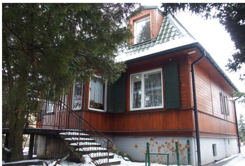
Widok budynku od wschodu